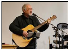
Open stage Seite 4