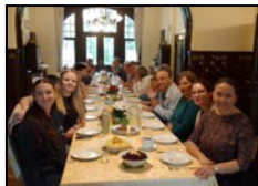
Gemeindefreizeit in Mehltheuer Seite 8

www.LKG-Hermsdorf.de YouTube Kanal: LKG Hermsdorf